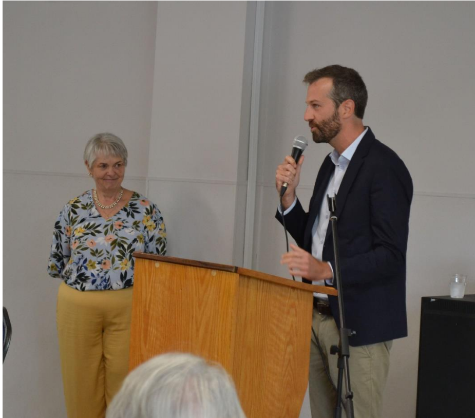
Mr. Joël Lightbound , député fédéral de Louis-Hébert