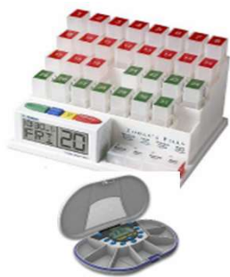
Pilulier avec rappels automatisés