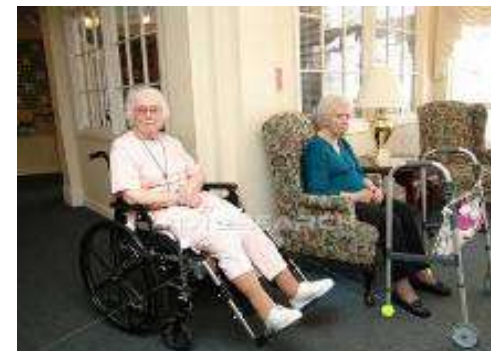
CHSLD/hôpital/résidences de personnes âgées