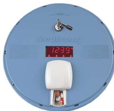
Distributeurs automatiques avec des alertes pour les aidants, p. ex., MedReady